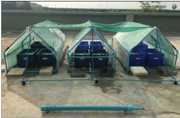
Figure 3 Greenhouses for hydroponic system