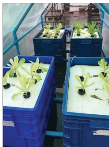
Figure 2 Lettuce in the DFT hydroponic system